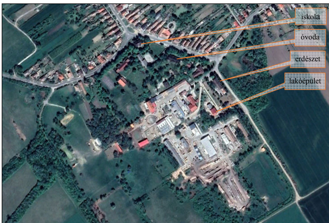
Forrás: google earth

Az önkormányzat szándéka a működő gazdasági egységek számára olyan építési jogok biztosítása, melyek nem lehetetlenítik el azok működését, sőt segítik azt, ugyanakkor a település számára sem eredményeznek közvetlen zavaró hatást.