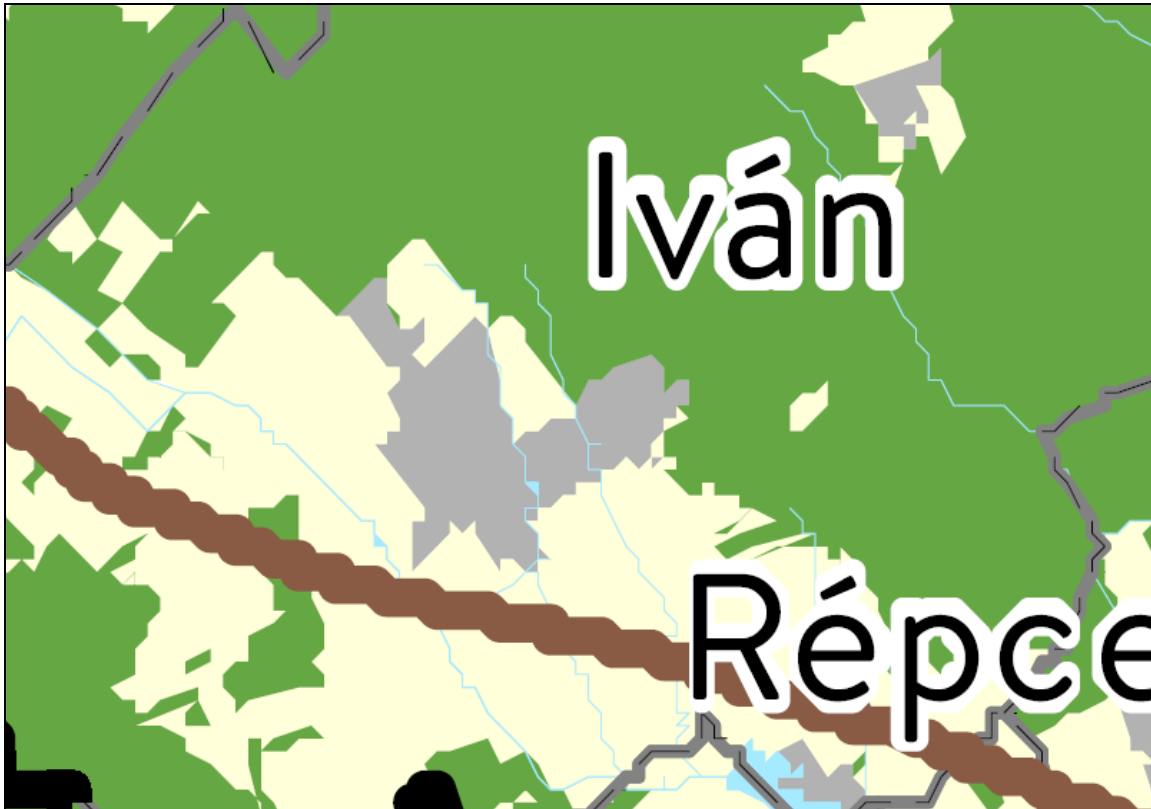
Kivonat „Az Ország Szerkezeti Terve” című tervlapból

A változtatással érintett területet a terv települési térségbe sorolja. A törvény 5. § (2) bekezdése szerint: